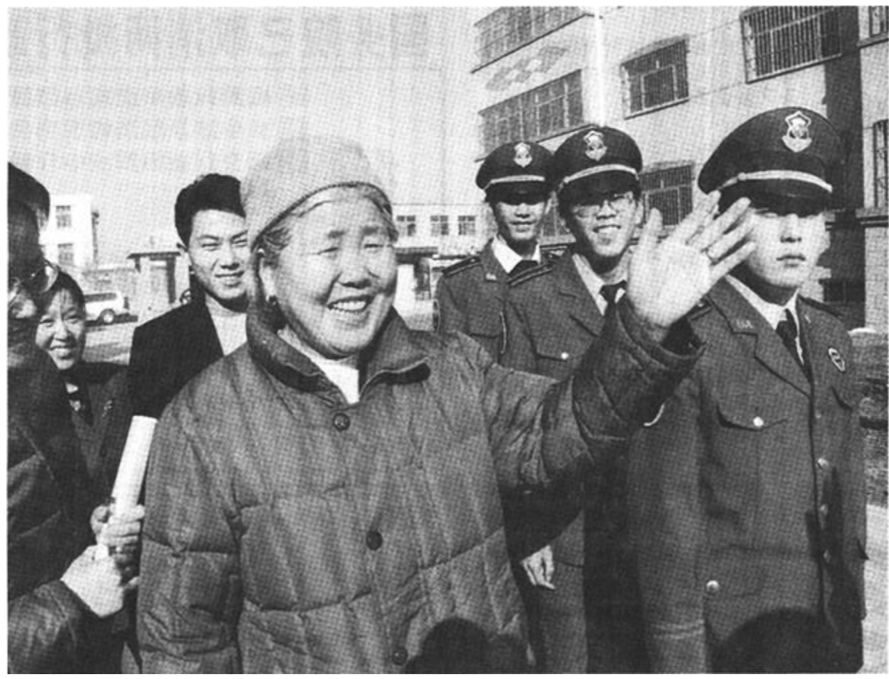
东营区黄河路街道东赵居委会专门投资十多万元购买了综治用车，配备了治安专用电话，为防范治安事件的发生及迅速出警提供了极大的方便。同时，该居还聘请了五名专职巡逻队员二十四小时在村居小区巡逻，使村居治安状况有了明显好转。