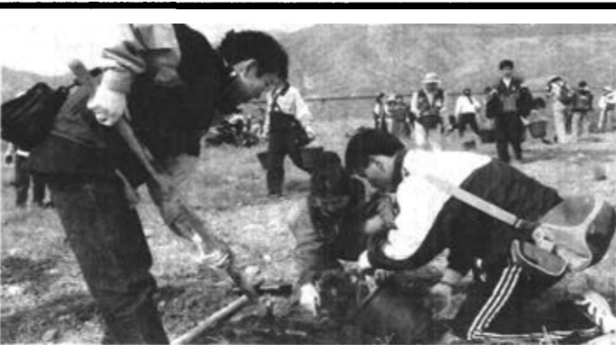
4月8日，一位中国大学生（右一）和两名韩国大学生在呼和浩特大青山山下植树。当天，来自汉城大学和釜山大学等十多所韩国大学的66名韩国大学生和中国内蒙古农业大学的120多名大学生一起参加第二届中韩友好未来林植树活动，在呼和浩特北郊的大青山共同植树。 本版编辑 张延涛 本版校对 刘铭芬